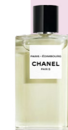
Chanel Paris - Édimbourg, aromatisch-holzige Eau de Toilette, chanel.ch, ab CHF 120.-