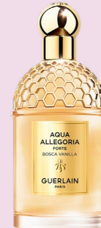
Guerlain Aqua Allegoria Forte Bosca Vanilla, würzig-holzige, guerlain.ch, ab CHF 145.-