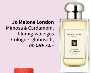
Jo Malone London Mimosa & Cardamom, blumig-würziges Cologne, globus.ch, ab CHF 72.-