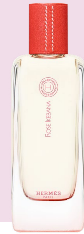
Hermès Hermès essence Rose Ikebana, fruchtig-blumiges Eau de Toilette, hermes.ch, ab CHF 310.-