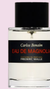
Editions de Parfums Frédéric Malle Eau de Magnolia, blumig-frisch, bongenie-grieder.ch, ab CHF 195.-