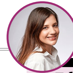
Die Seiten wurden zusammengestellt von Vanessa Kim.